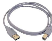
Cable de transmi- sión, terminado con conector USB